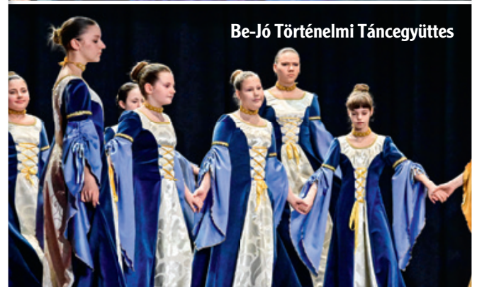
Be-Jó Történelmi Táncgyűttes