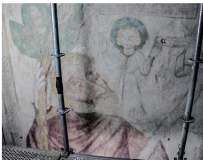
Szent Kristóf falfestmény, ami a középkori szokásnak megfelelően órásként mutatja meg a gyermek Jézust vállán vivő szentet.