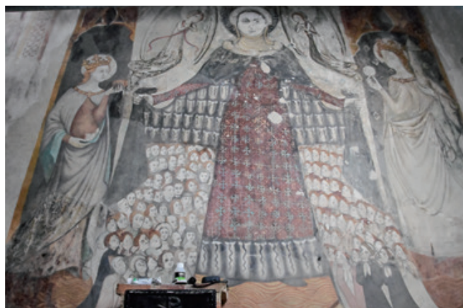
A Köpönyeges Madonna restaurálásán készült foto