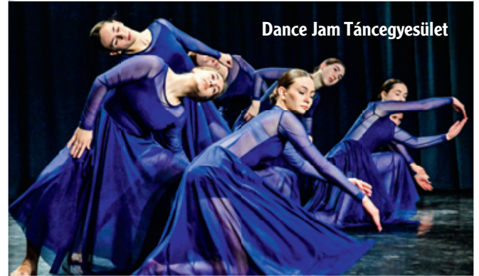
Dance Jam Táncgyűttes