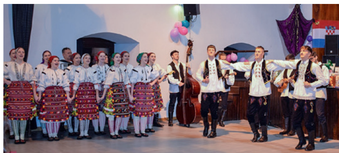
Dio kulturnoga program

A közel 200 főt számláló kőszegi Horvát bál sikeres lebonyolításában jelentős szerep jutott a szentpéterfai HKD Gradišće tamburásainak, táncosainak, valamint a Pinka Band zenekarnak. A fel-