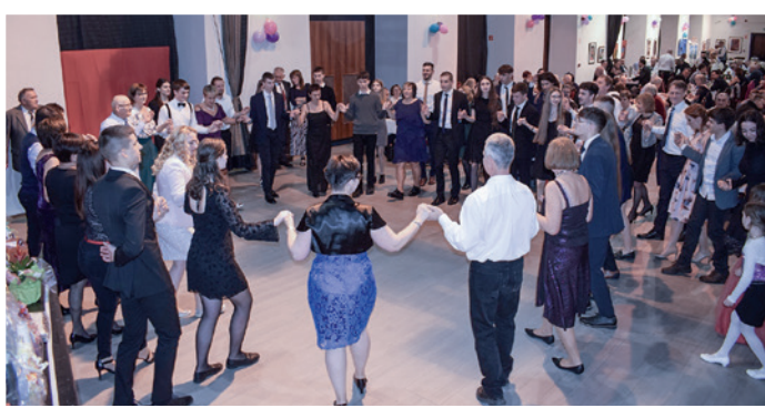
Skupni tanac gostov