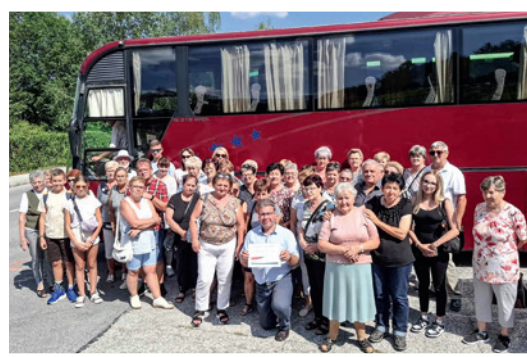
Veliko mnoštvo vjernikov je autobusom putovalo