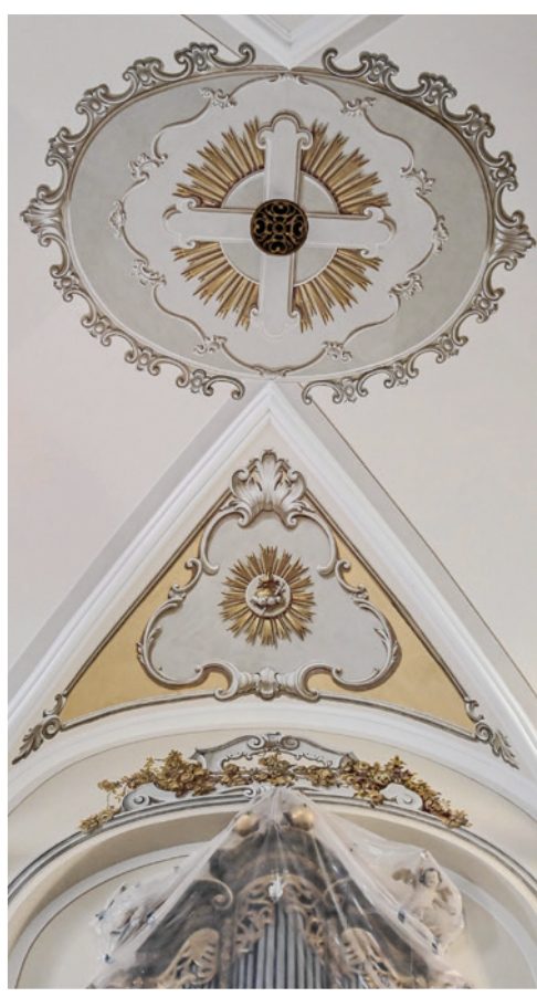
A Szent Imre-templom boltozata orgonával