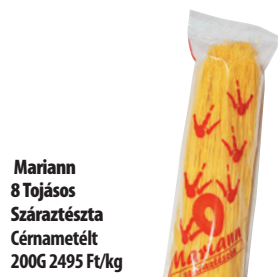
Mariann 8 Tojásos Száraztészta Cérnabetélt 200G 2495 Ft/kg