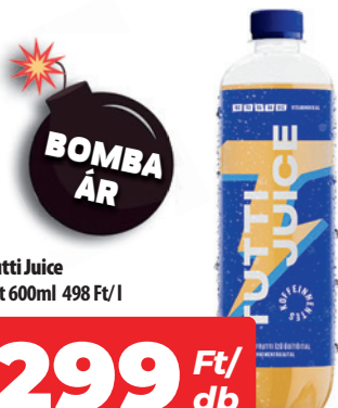
Tutti Juice pet 600ml 498 Ft/l