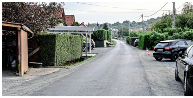
Dr. Ambró Gyula utca

A körforgalom után a híd mellett épült meg 2023-ban a Gyöngyös patakon átvezető híd. Az önkormányzat ehhez megkapta a Kormánytól a támogatást, az építése az intermodális csomópontoz