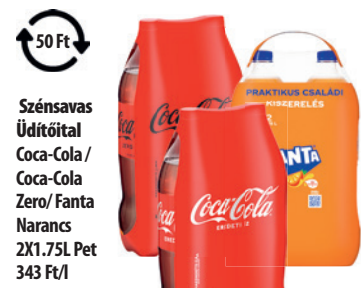
Szénsavas Üdítőital Coca-Cola / Coca-Cola Zero/ Fanta Narancs 2X1.75L Pet 343 Ft/l