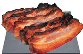
Új Palini Sült Császárszalonna 4999Ft/kg