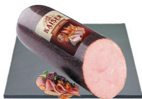
Kaiser Cigánysonka 3890 Ft/kg