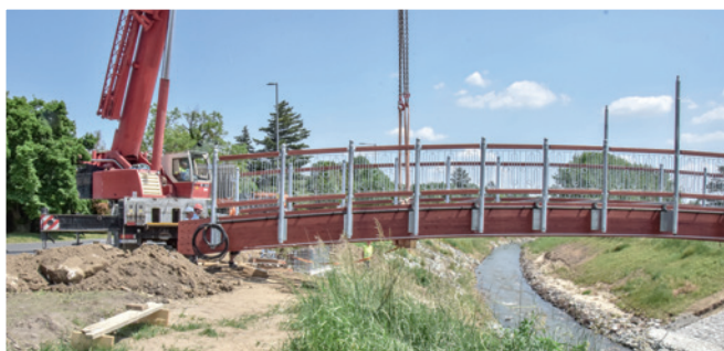
Gyalogos, kerékpáros híd építése 2023. június 1-jén