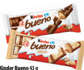
Kinder Bueno 43 g /Kinder Bueno White 39 g