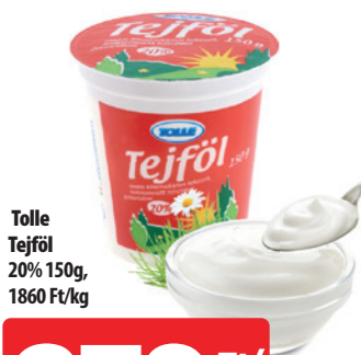
Tolle Tefföl 20% 150g, 1860 Ft/kg