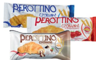
Perottino Töltött Croissant Eper / Kakaós/ Kakaós-Vanília 55G 2891 Ft/kg