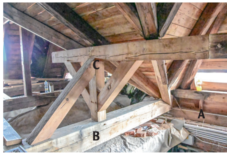
2. kép: A – sárgerenda; B – kötőgerenda; C – szelemengerenda

hogy a kötőgerendákat (1/A és 2/B), illetve az oldalfalon lévő sárgerendákat (2/A) cserélni tudják, meg kell emelni a tetőzet egy-egy szakaszát. Azzal a menetes kiképzésű emelővel végzik (1/B), amit a toronysisak emelésénél is használtak. A templom két oldalán lévő tetőzetet a 19. század végén 30 mm vastag vas/kötőrudakkal (1/C) kötötték össze, amik elindulnak a kötőgerendából (1/A és 2/B), és átmegy a másik oldalán is lévő szelemengendákhoz (1/E). Ezeket a vas/kötőrudakat (1/C) ki kell venni a gerendacserék idejére. A tető stabilitásának megtartása érdekében sodronyköteleket (1/F) építettek be. Csak ezt a munkát négy szakember egy hét alatt tudja elvégezni. A kötő-, vagy sárgerenda cseréje is időigényes. Azokat, vagy annak egy részét cserélik ki, amelyeket egy előzetes szakmai felmérés kijelölt, ezt teszik a fentebb lévő szelemengerendákkal (1/E és 2/C) is. Az új és eredeti gerendák toldását hagyományos, régi ácskötésekkel végzik el. Ennek elvégzéséhez nagyon szükséges a kiváló szakmai tudás. Amikor egy megemelt szakasz korhadt gerendáit kicserélték, azt követően befedik helyben falcolt, átfedéssel rendelkező deszkákkal. Ezt követik a tetőn végzendő további munkák.