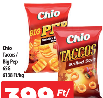
Chio Taccos/ Big Pep 65G 6138 Ft/kg