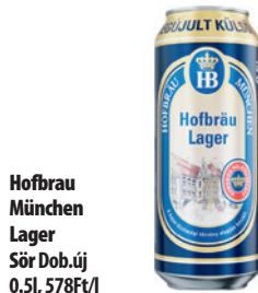
Hofbrau München Lager Sör Dob.új 0.5l, 578Ft/l