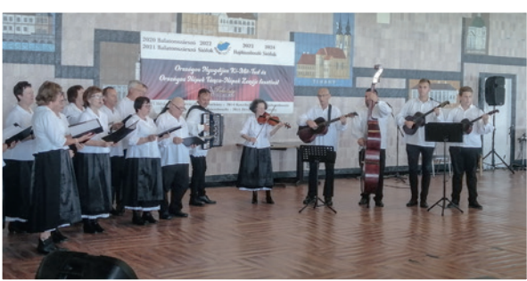
Nastup u Siófoku

U 2002. ljetu utemeljen pjevački zbor Zora - uz pjevače uključujući se kasnije instrumentalna pratnja - tambure, gitara, harmonika i violina. Ovim podupiranjem pjesme im dobiju novi lik, novi čar. Ljetos 25. maja uspješno su nastupili kod starih prijatelja u Orehovici (HR) na „Orehijadi” - na festivalu oreha i sega kaj kcoj ide. Malo kasnije 26. aprila sudjelovali su na naticanju umirovljenika „Tko - Što - Zna?” i na smotri „Tanci i muzika narodov” u Šiófoku. Sve dve kategorije su im u finalu nagradjene izvanrednom zlatnom ocjenom. Uz osnivača zbora Mirka Berlakovića, uz stručno peljačtvo pokojnoga Józsefa Maitza i sadašnju peljačicu Edit Tóth- Nagy važnu ulogu nosi u društvu Imre Harsányi. Njegova muzička