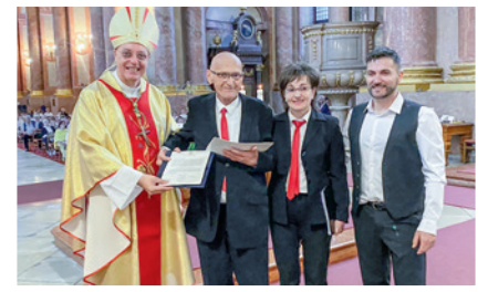
Spomen kip odlikovanja