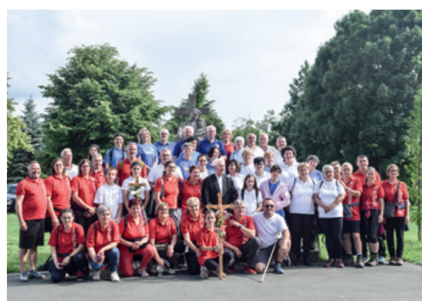
Vjerniki ki su piše hodočastili u Vincjet